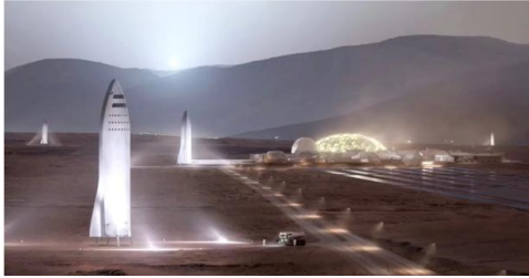
Ilustración 10: cohetes en Marte, reutilizables y capaces de transportar a 100 pasajeros

El físico, inventor y empresario Elon Musk, fundador de SpaceX, Tesla Motors y Solar City, cree que la humanidad corre el riesgo de extinción por vivir en un solo planeta. Su solución es establecer una colonia autosustentable en Marte. Según Musk, la tecnología que está desarrollando SpaceX, basada en naves espaciales con propulsión de metano y fuselajes de fibra de carbono, permitiría comenzar a colonizar el planeta rojo a partir de la próxima década y crear, así, una civilización sustentable de un millón de habitantes en Marte.