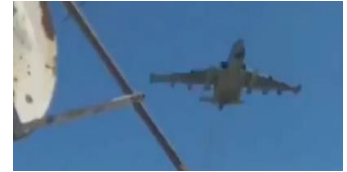
Ilustración 2: del artículo

https://www.pucara.org/post/la-aviaci%C3%B3n-militar-rusa-en-la-guerra-con-ucrania