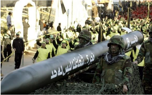
Ilustración 5: del artículo

El temor de Tel Aviv al arsenal de Hezbolá está justificado, porque su gran número lo convierte en un arma letal contra el frente interno israelí, y las estimaciones israelíes indican que, en vísperas de la Segunda Guerra del Líbano, Hezbolá poseía 15 000 misiles, de los cuales 4000 fueron lanzados hacia el norte. Hoy, sin embargo, se estima que tiene más de 100 000 misiles.