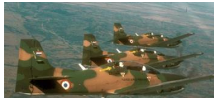
Ilustración 3: aviones Tucano de la FAP

La Cámara de Diputados de Paraguay presentó un proyecto de ley que faculta a su Fuerza Aérea (FAP) a ejecutar tiros intimidatorios contra aeronaves sospechosas o no identificadas. Si bien el proyecto original establecía la posibilidad de “eliminación”, cuando estuviesen agotados todos los medios coercitivos previstos en las normas nacionales e internacionales y previo a haber calificado a la aeronave como hostil, este no habría prosperado.