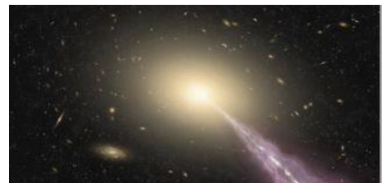
Ilustración 4: Impresión artística de una galaxia que alberga un cuásar y libera un chorro de partículas fuera de la galaxia Crédito de la imagen: ALMA (ESO/NAOJ/NRAO)

https://www.space.com/quasar-supermassive-black-hole-radio-glow-unknown-structure?utm_source=SmartBrief&utm_medium=email&utm_campaign=58E4DE65-C57F-4CD3-9A5A-609994E2C5A9&utm_content=6D442D4C-3B31-49F5-B650-1545E5E1DF34&utm_term=c341ba23-a970-42c4-b4a3-6f3d3ed3cff5