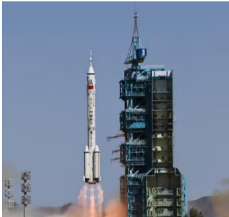
Ilustración 9: de la agencia de noticias Xinhua, cohete portador Gran Marcha-2F, que transporta la nave espacial Shenzhou 14

El 5 de junio, China lanzó una misión de tres personas para completar el trabajo de ensamblaje en su estación espacial en órbita permanente. La misión tiene por objetivo ensamblar la estructura de tres módulos que unirá el Tianhe existente con Wentian y Mengtian, que llegará en julio y octubre de este año.