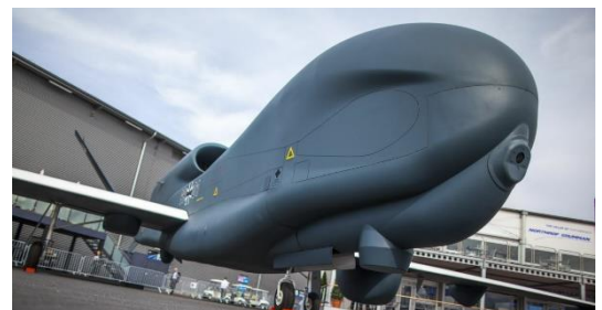
Ilustración 7: del artículo

Japón planea desarrollar aviones no tripulados que volarán en apoyo de aviones de combate. El nuevo dron empleará inteligencia artificial para evaluar el terreno y las condiciones climáticas, que en última instancia determinarán la forma en que vuelan. El gobierno japonés está considerando permitir que esta nueva clase de drones transporte misiles.