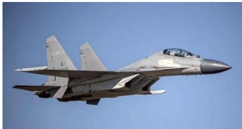
Ilustración 1: Caza chino J-16

El Departamento de Defensa de Australia señala que un avión de combate chino J-16 interceptó "peligrosamente" a un avión de vigilancia militar australiano (P-8 POSEIDON) en la región del Mar de China Meridional en mayo. Según declaraciones, el avión chino habría lanzado un paquete de chaff ingeridos por el P-8 australiano.